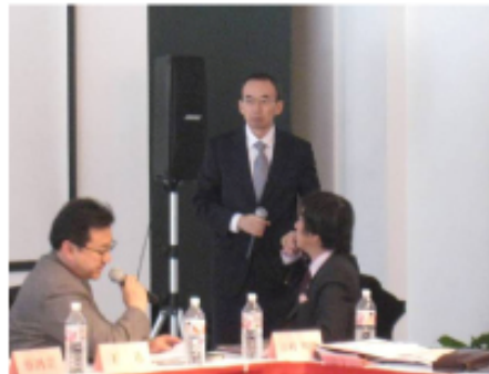
▲吉村総務委員長様より日中建協のご紹介