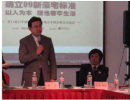
▲会議の様子(於:北京首創館)・左側席が楼市メディア会員、右側席が分科会会員